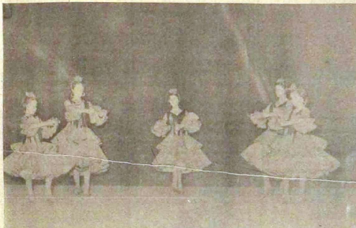
ambos los progresos obtenidos en disciplinas nada fáciles como es la danza y el ballet, que el público premio como encendidos aplausos. Aquí dejamos constancia gráfica de ambas galas por el orden citado.