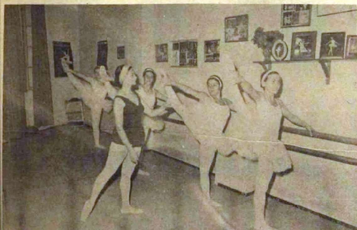
Dos galas fin de curso de ballet y danza clásica, conoció nuestra ciudad el miércoles y jueves, dados uno en la Escuela Municipal de Bellas y otro en el Teatro Circo, por las alumnas de las profesoras doña Adelaida Alvarez y doña María Jesús Rodríguez, respectivamente, revelando

No pasó nada, gracias a Dios, pero hubiera podido pasar. Que así quedó un camión cargado de gaseosas y bebidas refrescantes que fue a estrellarse contra un hueco de la calle de Gonzalo Barrachina, sin que hubiera que lamentar desgracia personal alguna, y sí sólo los vidrios rotos de numerosas botellas que transportaba el vehículo.— (Fotos Carlos Coloma).